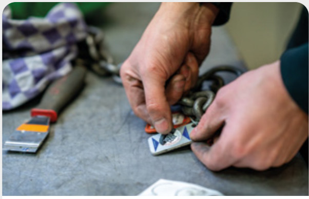
Keuren & certificeren