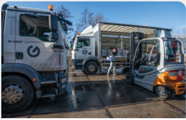
Transport & logistiek